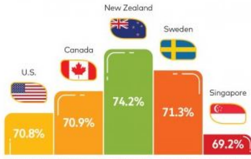
MIWE 2018 Top 5 Countries