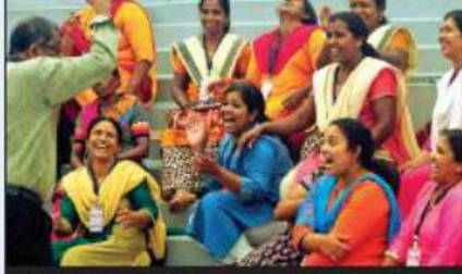
A file photo of Kudumbashree members attending a drama workshop

► The Public Affairs Index 2018 released by the thinktank Public Affairs Centre examines governance performance in the states through a data-based framework, ranking them on social and economic development