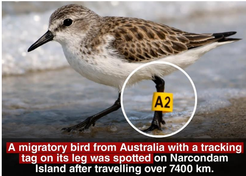
A migratory bird from Australia with a tracking tag on its leg was spotted on Narcondam Island after travelling over 7400 km.