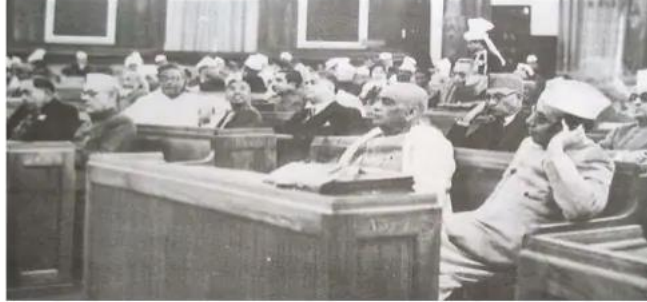
First day (December 9, 1946) of the Constituent Assembly. From right: B. G. Kher and Sardar Vallabhai Patel; K. M. Munshi is seated behind Patel.

The Constituent Assembly consisted of 385 members, of which 292 were elected by the elected members of the Provincial Legislative Assemblies while 93 members were nominated by the Princely States. To these were to be added a representative each from the four Chief Commissioners Provinces of Delhi, Ajmer- Marwar, Coorg and British Baluchistan.