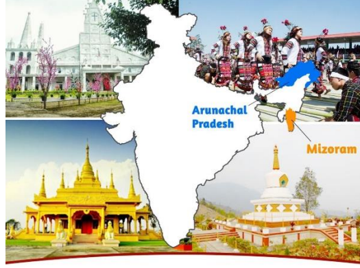
Mizoram And Arunachal Pradesh Statehood Day - 20 February

அருணாச்சலப் பிரதேச மாநில நிறுவன தினம் - பிப்ரவரி 20