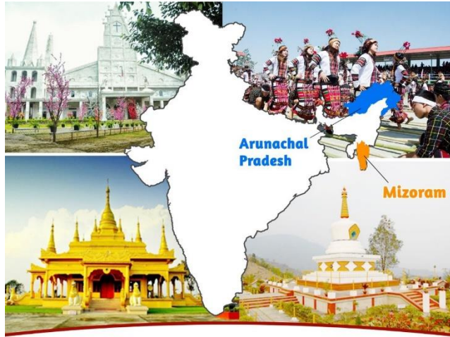
Mizoram And Arunachal Pradesh Statehood Day - 20 February