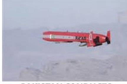
PAKISTAN CONDUCTS SUCCESSFUL FLIGHT TEST OF RA'AD-II CRUISE MISSILE