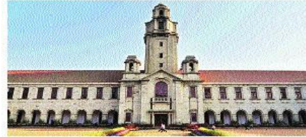
While IISc retained its top position among Indian varsities, it fell two places to 16