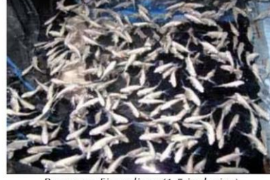
Pompano Fingerlings (1.5 inch size)