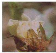
Rosette flower தாக்கப்பட்ட பூஞ்சேர்த்து