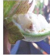
Early instar larva இளம்பருவ பழு