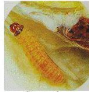
Grownup larva முதிர்ந்த பழு