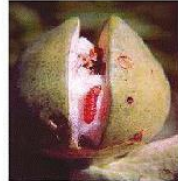
Damaged boll சேதம் அடைந்த காய்