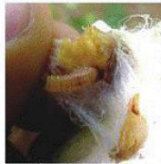
Larval feeding காயில் பழுவின தாக்குதல்