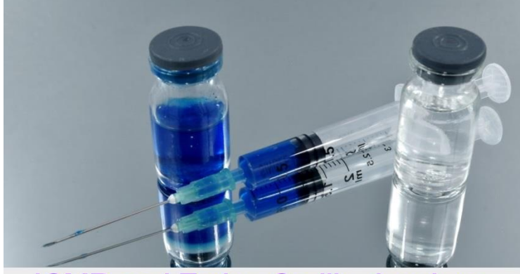
ICMR and Zydus Cadila develops IgG ELISA test for antibody detection