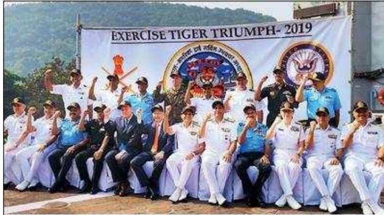
SHOW OF COMBINED STRENGTH: The harbour phase of Tiger Triumph— India-US joint tri-services HADR exercise began on board INS Jalashwa on Thursday. The exercise, which will go on for a week, is intended to represent the growing strategic partnership between the two countries