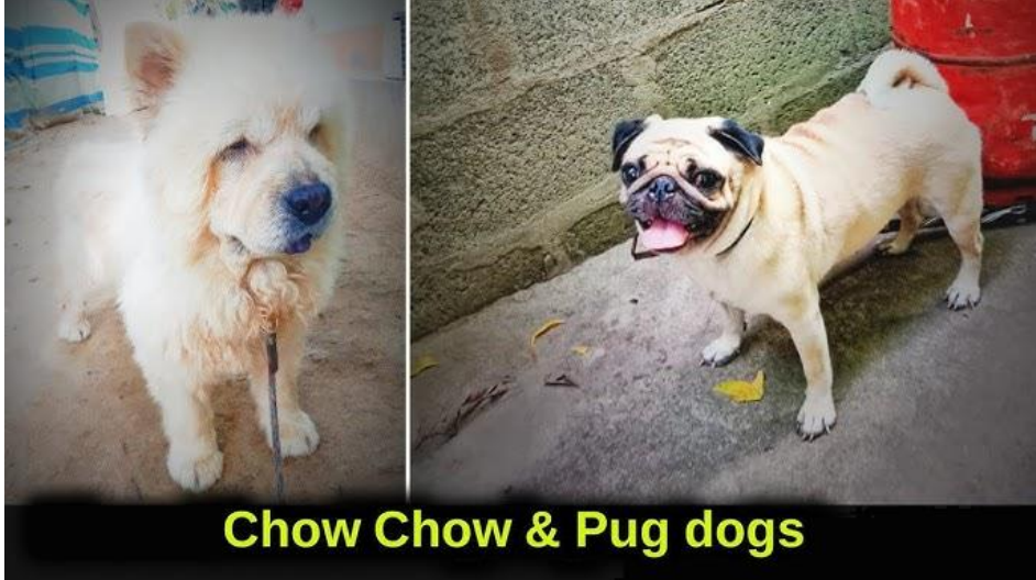
Chow Chow & Pug dogs