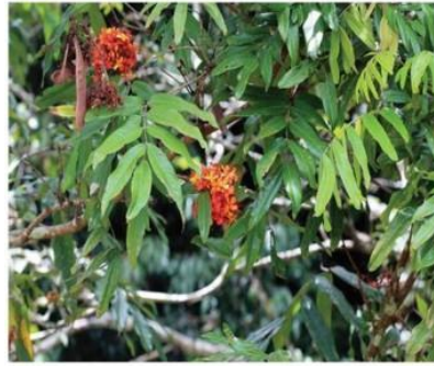
Saraca asoca (Roxb.) Willd.