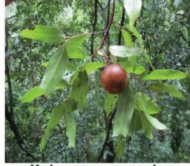
Hydnocarpus pentandrus (Buch.-Ham.) Oken