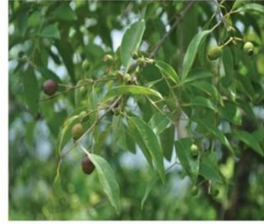
Santalum album L.