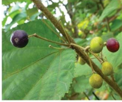
Embelia ribes Burm.f.

அரிதான மற்றும் அச்சுறுத்தப்பட்ட நிலையில் உள்ள தாவரங்கள் பாதுகாப்புத் திட்டம்