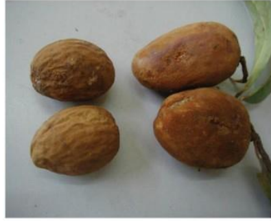
Myristica malabarica Lam.