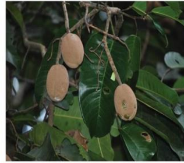
Vateria indica L.