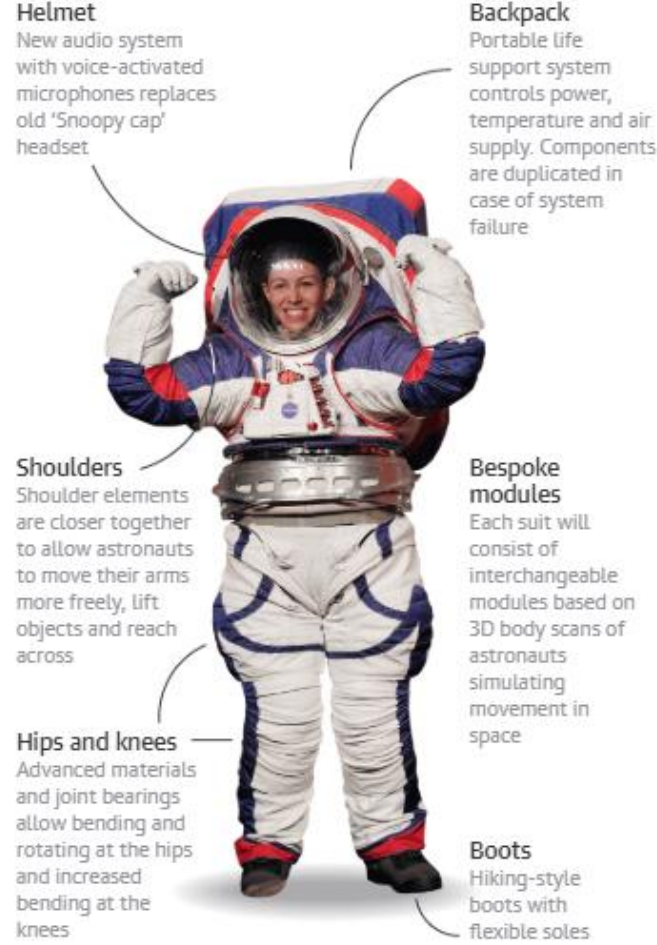
Guardian graphic.