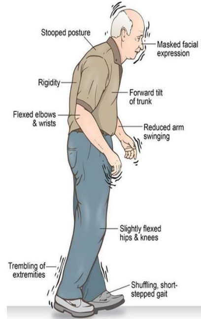
Typical appearance of Parkinson's disease