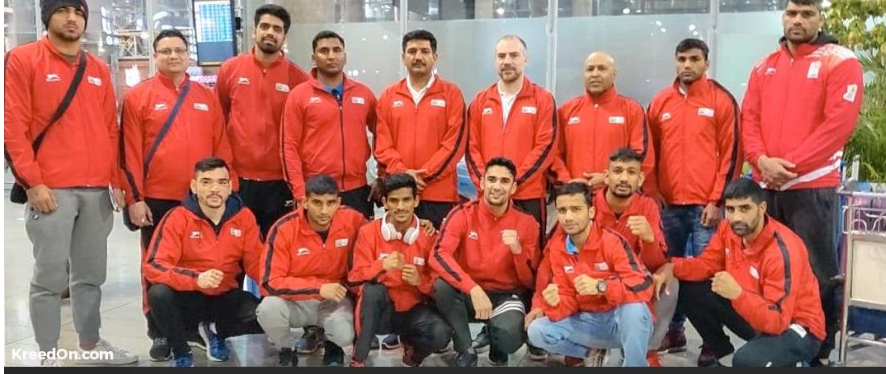
1 GOLD ,5 SILVER & 2 BRONZE MEDALS AT MAKRAN CUP